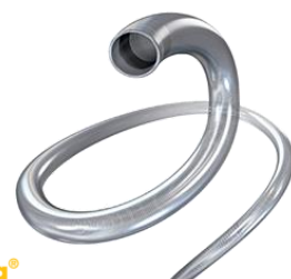
AXS Vecta® Aspiration Catheter